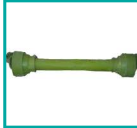
Albero cardanico PTO Shaft