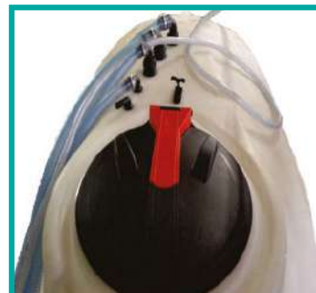
Serbatoio con tappo a vite Polyethylene tank with screw lid