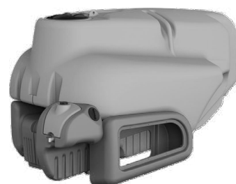
Botte Rio Plus Rio Plus tank