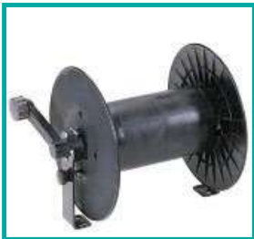
Bobina tubo Hose reel