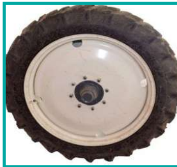
Pneumatico R44 Tyres R44