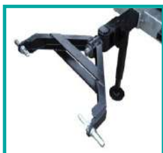
Timone sterzante Steering rod