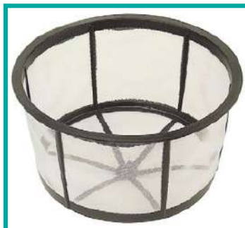
Filtro a setaccio Stainer filter