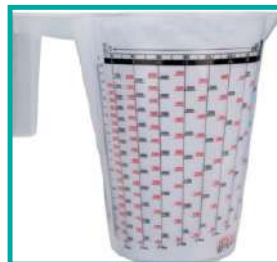
Caraffa di controllo ugelli Nozzle check carafe