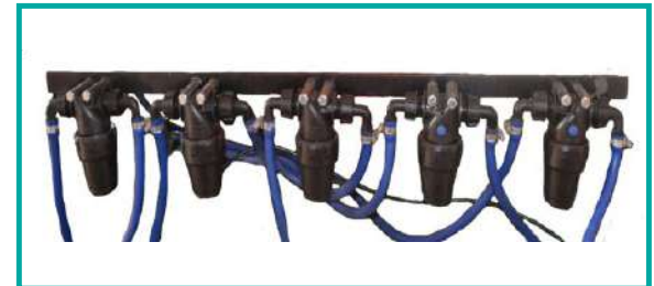
Filtri in linea Line filters