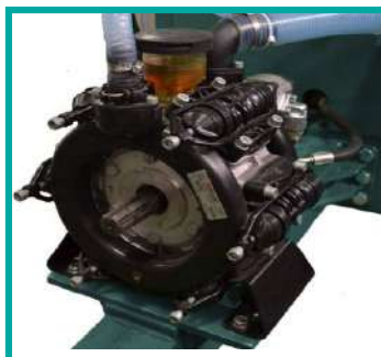
Pompa a diaframma Diaphragm pump