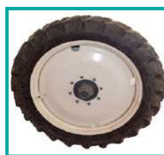
Pneumatico R38-R46 Tyres R38-R46