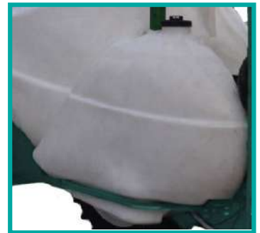
Serbatoio lavamani e lavacircuito Hand and circuit washing tank