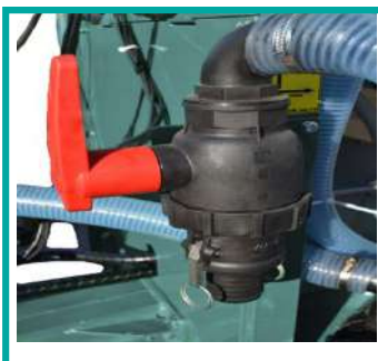
Filtro predisposto per l'autoriempimento Intake filter predisposed for self-filling