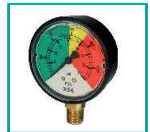
Misuratore di pressione Ø100 Pressure gauges Ø100