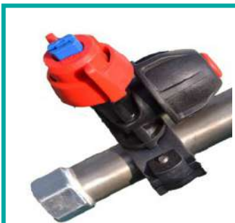
Supporto ugello completo di ugello e anti-caduta Nozzle holder complete with nozzle and anti drop