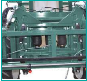
Sospensioni ad aria della barra Boom air suspension