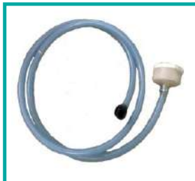
Kit autoriempimento Self filling kit