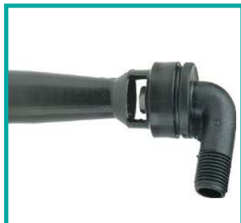
Agitatore idraulico Hydraulic agitator