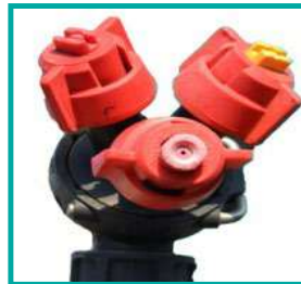
Ugelli a triplo jet Trijet nozzles