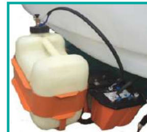
Tracciafile schiumogeno Foam marker