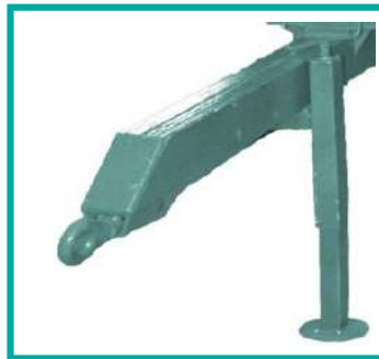
Timone fisso e piedino meccanico Fix rod and mechanical presser foot