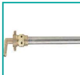
Agitatore a tubo Tube agitator