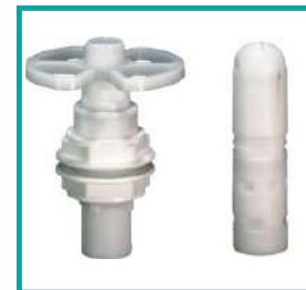
Kit lava serbatoio Kit washing tank