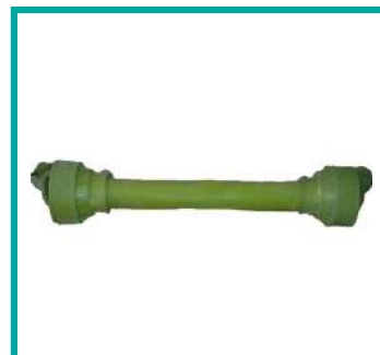
Albero cardanico PTO Shaft