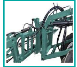
Sollevamento idraulico della barra Hydraulic lifting booms