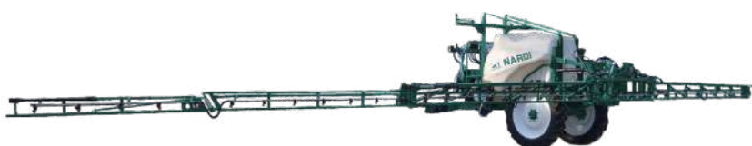
Apertura della barra idraulica Hydraulic opening booms

Nardi trailed sprayers has been designed to answer the current and future requirements of modern agriculture. Models RIO- RIO Plus are equipped with cutting edge technology which adjust to the strict condition and regulations in contemporary agriculture crop protection. Nardi produces the implements with a great care of enviroment and users of product and in this purpose have a large number of different sprayers in this series with tank capacities ranging from 2500-5200l, with best quality components, which with wide range of use can meet the expectations of even most demanding users.