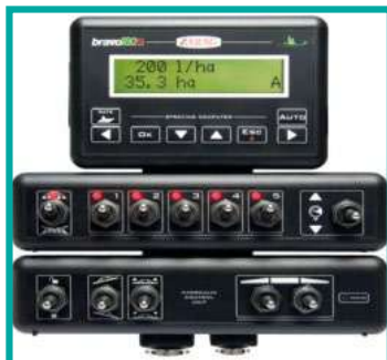
Computer Bravo 180 Computer Bravo 180